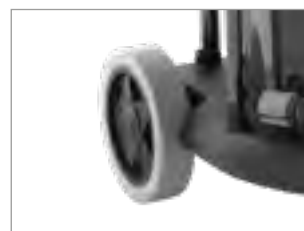
DUŻE KOŁA Z OPONAMI